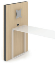
Medienwand** mit VESA-Halterung - CMZ124