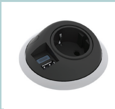
Steckdose SHZ004 (EU, UK, FR, CH)