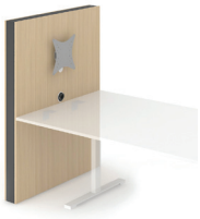
Medienwand* mit VESA-Halterung - CMZ123