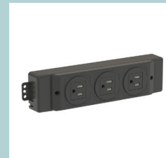
Steckdosenblock für Medien (EU, UK, FR, CH)