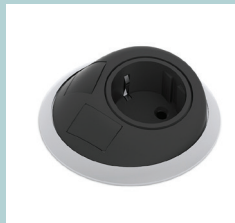
Steckdose SHZ005 (EU, UK, FR, CH)