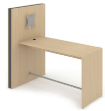
Medienwand (1200x132, H=1860 mm) mit VESA-Halterung und fix montiertem Hochtisch (1800x800, H=1050 mm) - CMM190